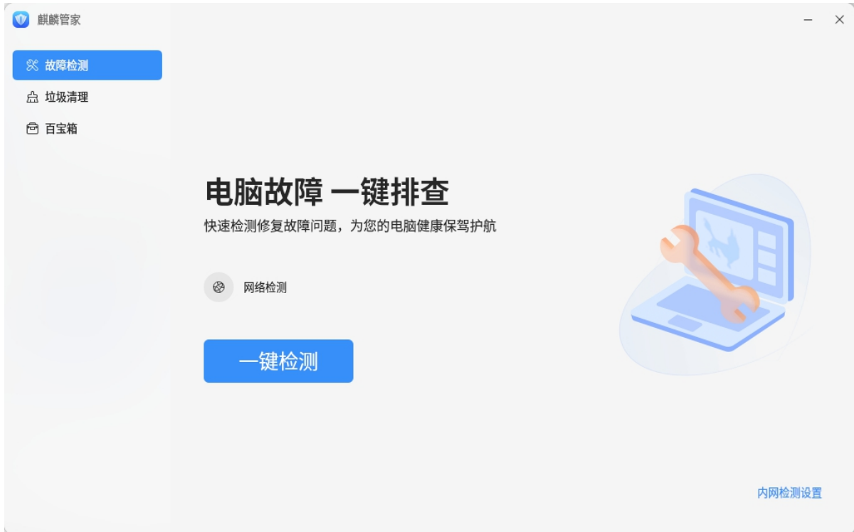
图 3 -2 麒麟管家