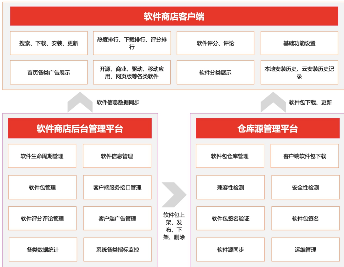
图 3 -4 私有化部署整体架构图

有化版) 解决方案, 以解决内网环境下无法下载软件、管理软件的问题。整体架构图如下: