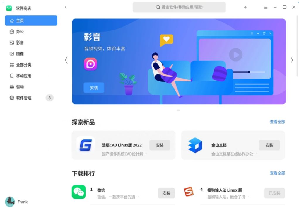
图 3 -1 软件商店登录界面